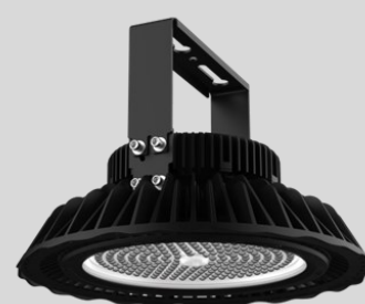
(Montagebügel optional erhältlich)