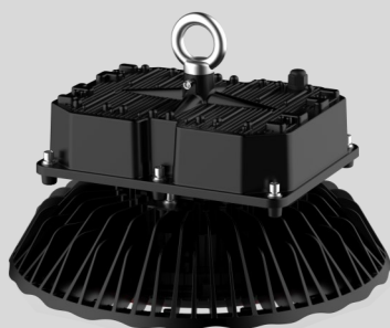
(Ausführungen mit 300W)

LED Hallenleuchte, IP65, Aluminiumgehäuse, gehärtetes Glas, MEAN WELL-Konstantstrom-Netzteil. Abstrahlwinkel 120°, 90° oder 50°/60°, ENEC-Zertifiziert, D-Zeichen. Auch als dimmbare Variante verfügbar. Verschiedene Montageoptionen für Wand, Decke und Pendel.